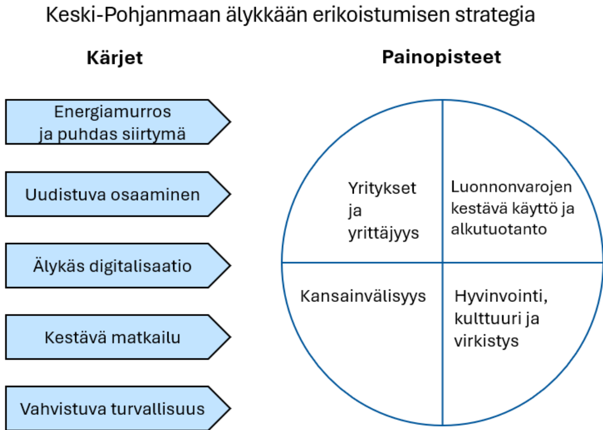
Kuva 3: Painopisteet ja kärjet.

Keski-Pohjanmaan painopisteet eli yritykset ja yrittäjyys, luonnonvarojen kestävä hyödyntäminen ja alkutuotanto, hyvinvointi ja kulttuuri sekä kansainvälisyys ovat maakunnan kivijalka. Painopisteet ovat maakunnassa jo olemassa olevia vahvuuksia, joilla on potentiaalia kehittyä edelleen. Keski-Pohjanmaa haluaa kehittää painopistealueita keskittyen kärjissä nostettuihin teemoihin eli energiamurrokseen, puhtaaseen siirtymään, uudistuvaan osaamiseen, älykkääseen digitalisaatioon, kestäväan matkailuun ja vahvistuvaan turvallisuuteen.