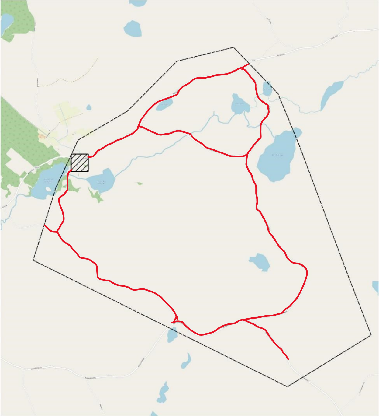
Kuva 1. Kartta Perhon Korkiakoski-Humalajoki